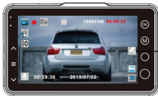
הפעלת ניטור החנייה

יש להיכנס להגדרות וידיאו כדי להדליק את מנטר החנייה או לכבותו. לאחר הפעלתו, צלמית ניטור החנייה תוצג בחלק המרכזי בצד ימין. כאשר מוניטור החנייה הופעל, המכשיר יכובה באופן אוטומטי לאחר כיבוי המנוע, אך עם זיהוי תנודה כלשהי, המכשיר יחזור למצב פעיל באופן אוטומטי. אם לא תזוהה כל חבטה נוספת במשך של כ-30 שניות, המכשיר ישמור את הקובץ המצולם, ינעל אותו ויכבה את עצמו שוב. אם מוניטור החנייה מופעל במהלך נהיגה, לא תהיה כל חבטה והמכשיר ימשיך להקליט באופן רגיל ללא הפרעה. הערה: כל סרטוני הוידאו שיצולמו על ידי מוניטור החנייה יסומנו כקובצי חירום ולא יידרסו על ידי הקלטה רגילה.