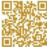
Android VF cam