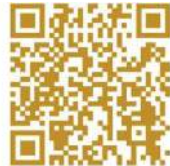
iOS VF cam